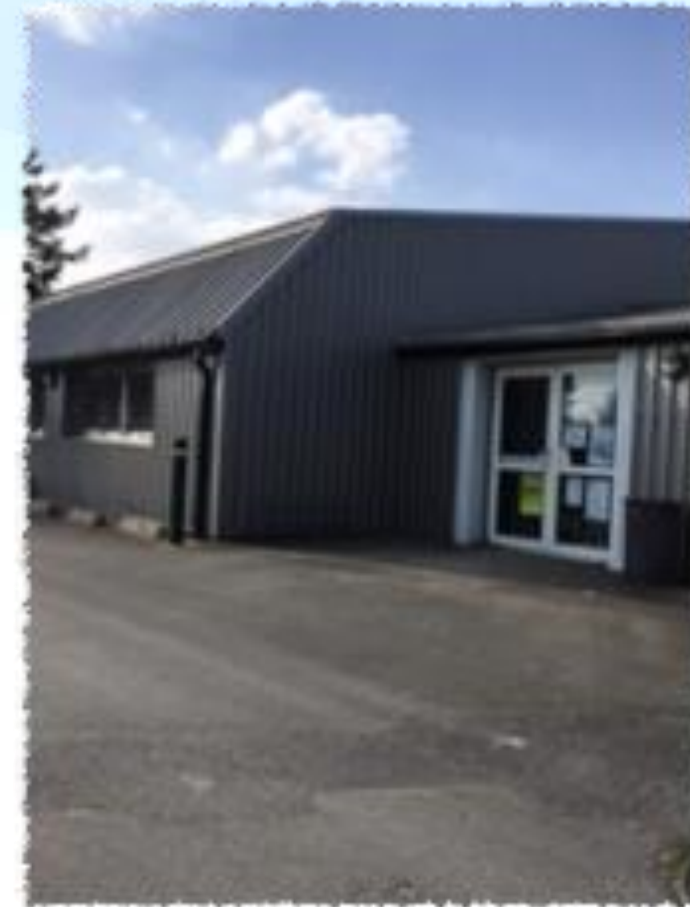
Le SPI, petite salle