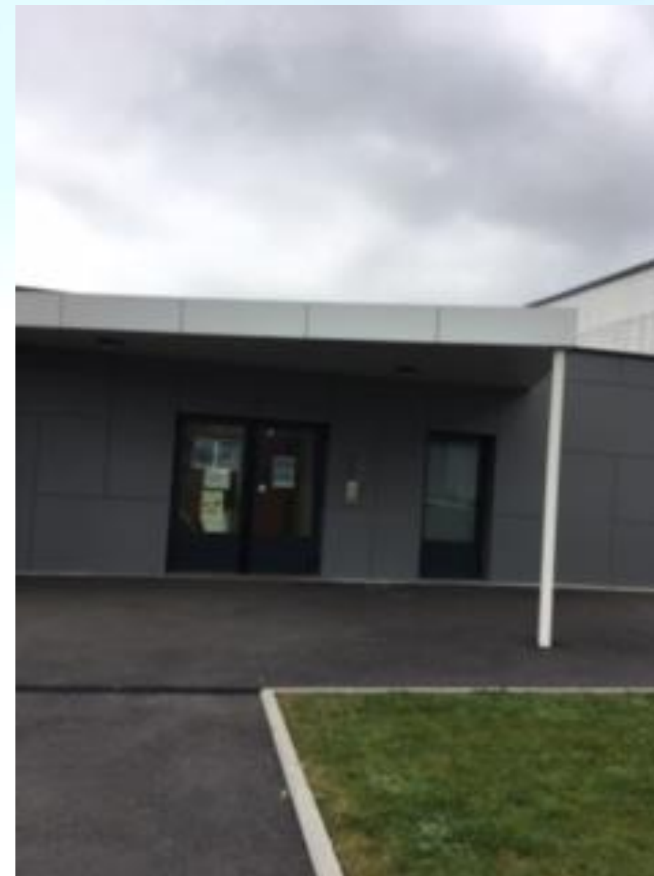
Le Triskel, salle mutualisable